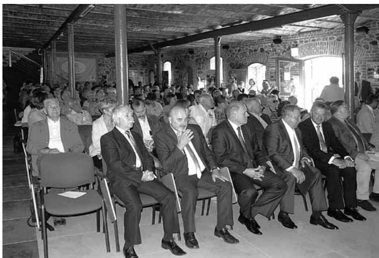
Audytoryum wojewódzkiej inauguracji Europejskich Dni Dziedzictwa