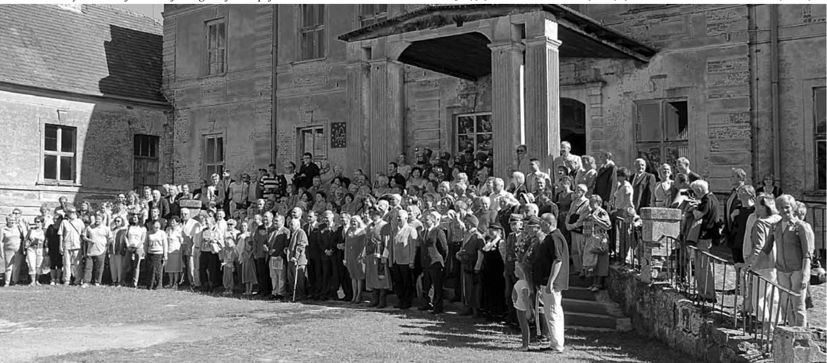
Pamiątkowe zdjęcie uczestników inauguracji wojewódzkiej EDD w Siemczynie