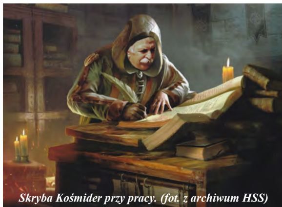
Skryba Kośmider przy pracy.