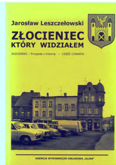
2. Okładki dwóch książek o historii Złocieńca J. Leszczelowskiego.

2018 r.: 22) „Ziemia drawska. Historie niezwykle”, 23) „Mirosławieckie wędrówki w pięciu wymiarach”, 24) „Wałeckie wędrówki w pięciu wymiarach” cz. I, 25) „Gronowskie gawędy historyczne”;