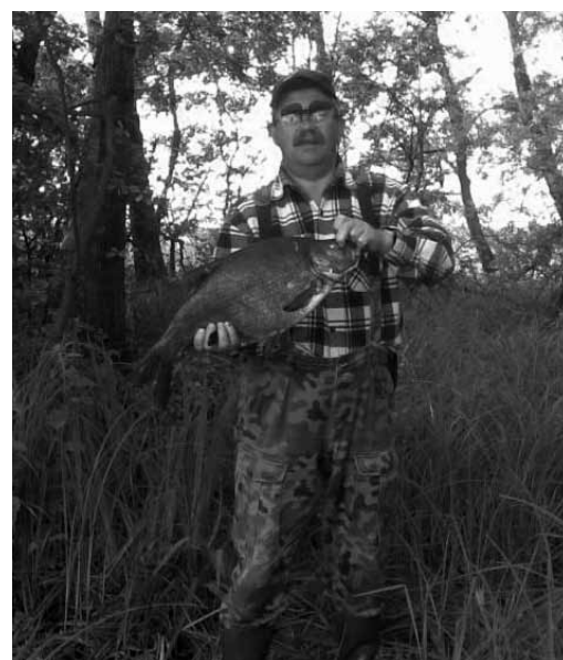
2011.06.29. 3,08 kg.