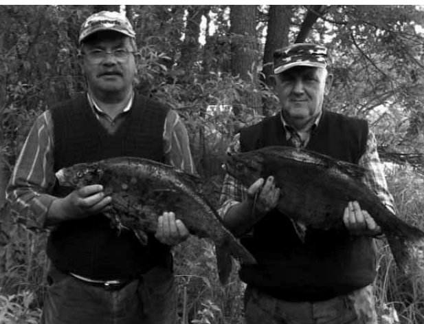
2010.07.31. J. Drawsko, leszcze ważyły po 3,40 kg, długości 65 i 64 cm.

ochronnego. Pochodzi z licznej u nas rodziny karpowatych, a w jeziorach jest główną rybą denną. Spasa pokarm z górnej powierzchni mułu. Ryje pyskiem w mule niczym dzik w kartoflisku, stąd łatwe do zauważenia stada poprzez pojawienie się tu i ówdzie banieczki gazu błotnego. Leszcz najlepiej czuje się w śródownisku wód stojących w jeziorach o dnie mulistym o średnich głębokościach. W jeziorach, gdzie występuje sieja nie jest mile widziany przez rybaków, gdyż stanowi konkurencję pokarmową. Tak jak inne ryby z rodziny karpowatych charakteryzuje się dużą plennością. Na jedną samicę przypada około 300 tys. ziarenek ikry, szarej, kleistej. Tarło odbywa na przełomie maja – czerwca. Opuszcza wówczas swoje żerowisko i nocą składa ikrę na roślinach. Samce można odróżnić po wysypce perłowej na łuskach. Dojrzeją w wieku 4-5 lat. Zmora rybaków i wędkarzy jest podobny krap. Towarzyszy leszczowi nawet się krzyżuje, dając gorsze potomstwo jeszcze bardziej ościste. Odróżnić go można po lekko zaczerwienio-