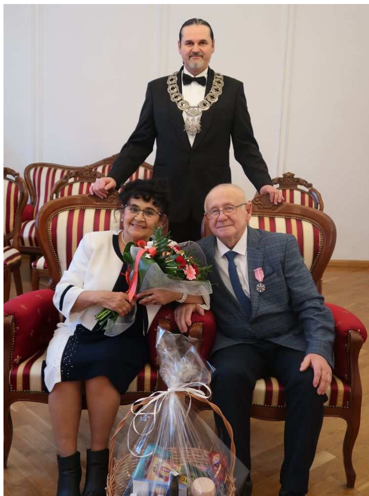
Jubileusz Państwa Siedlaków