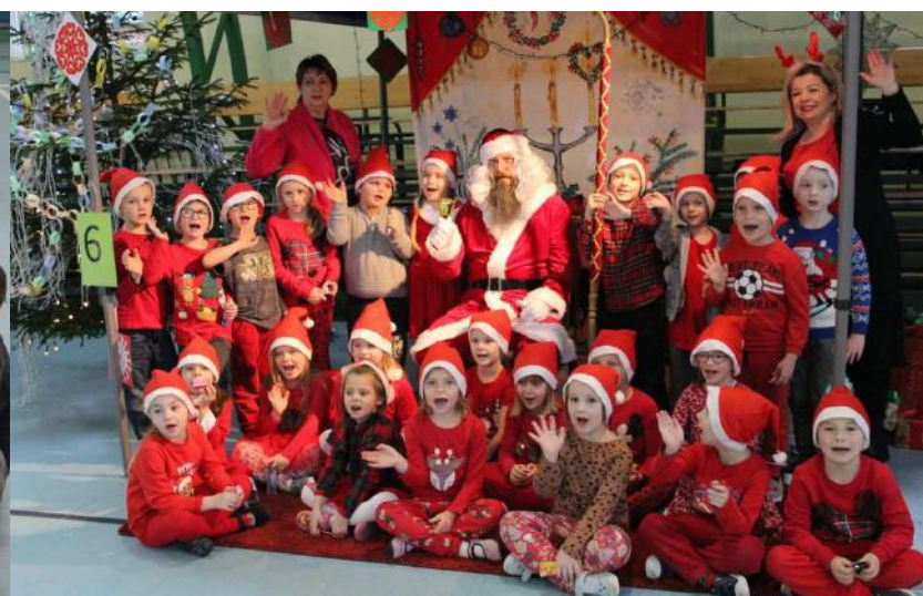
Mikołajki w hali widowiskowo-sportowej