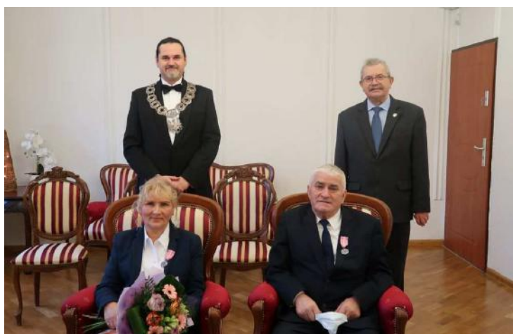
Jubileusz Państwa Łomaszewiczów