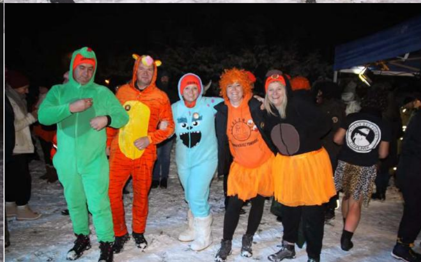
VI Afrykańskie Morsowanie z Pochodniami