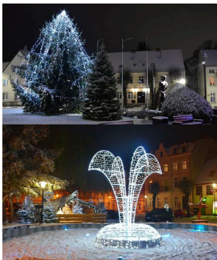
Iluminacje świąteczne w Czaplinku