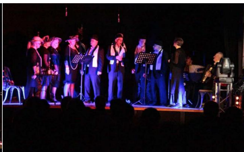
Spektakl „A to życie właśnie...”