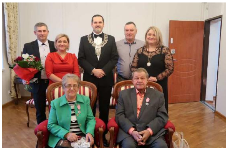
Jubileusz Państwa Mylków